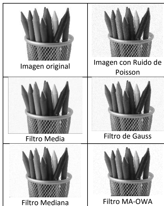
Figura 2. Imágenes de Lápices con Ruido de Poisson y Filtros.

mediante una operación de media aritmética, y en muchos casos, este cálculo no refleja de manera adecuada las opiniones de todos los usuarios.